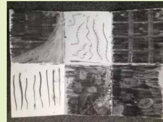
Experiment met houtskool door leerling van SBO Het Mozaïek

De leerlingen zagen dingen bij elkaar gebeuren en nieuwe dingen ontstaan in het tekenen. Daardoor werden ze verrijkt en het motiveerde hen om ook iets wat nieuw voor hen was uit te proberen.