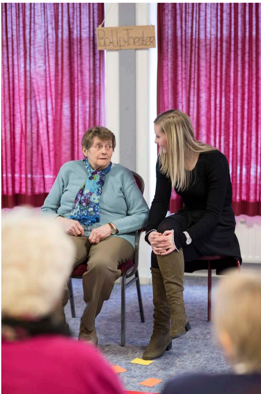
Van projecten: 'Van rijm tot Rap', Brummen 2016 'De Tuin van mijn Oma', Zutphen 2015 Inspiratiebijeenkomst 8 juli 2016 'Pop-Up-Theater', Laren 2017