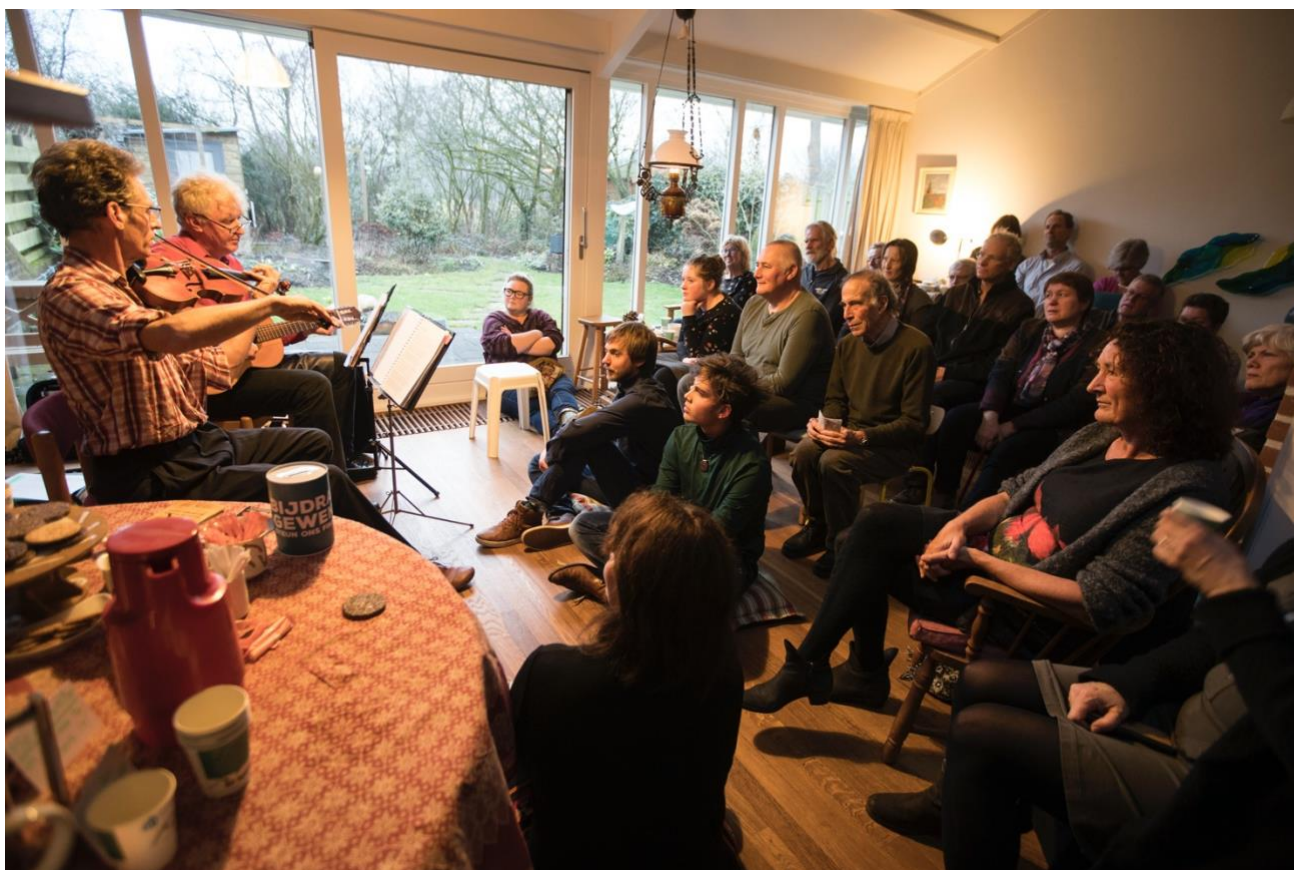
Gluren bij de Buren

Op zondag 10 februari 2019 vond het ééndaagsfestival Gluren bij de Buren Zutphen plaats met ruim 5.400 bezoekers in de leeftijd van 2 tot 90 jaar, in 69 huiskamers en met in totaal 206 optredens: van poëzie, theater en vertelkunst tot klassieke, wereld-, pop- en rockmuziek. Dat is een gemiddelde van 78 bezoekers per huiskamer.