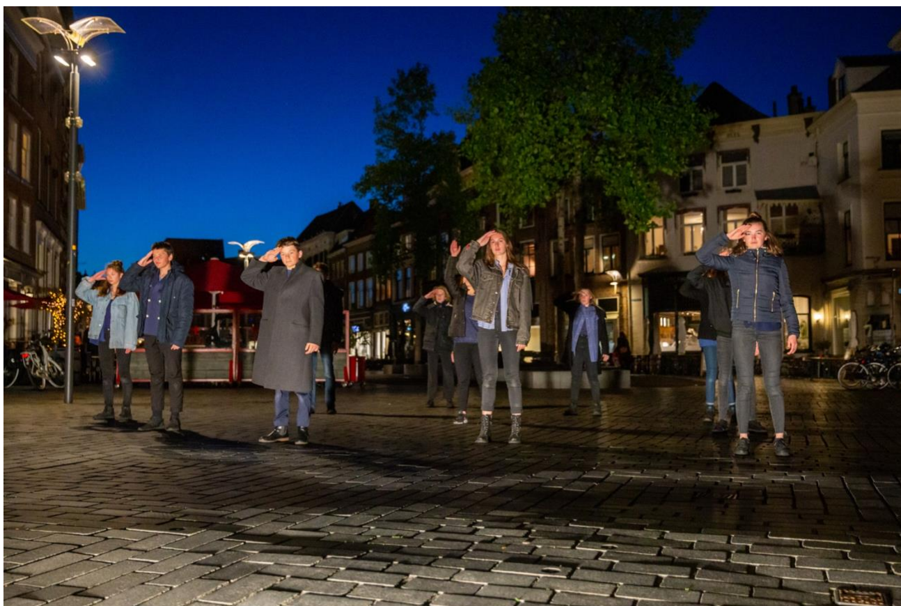
Theater na de Dam

Tijdens deze tiende editie van Theater na de Dam speelden in heel Nederland gelijktijdig 34 voorstellingen gebaseerd op gesprekken tussen jongeren en ouderen over de oorlog.