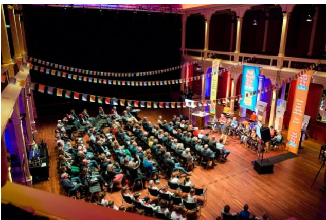
Meer Muziek in de Klas

Op 17 april 2019 was de convenantondertekening van Méér Muziek in de Klas Lokaal Zutphen, Lochem, Brummen en Voorst. Muzehof organiseerde en coördineerde dit evenement in samenwerking met Méér Muziek in de Klas (de landelijke organisatie). Na de convenantondertekening hief de stuurgroep zichzelf op en is een MuziekTafel ontstaan met als doel de afspraken van het convenant om te zetten in de praktijk.