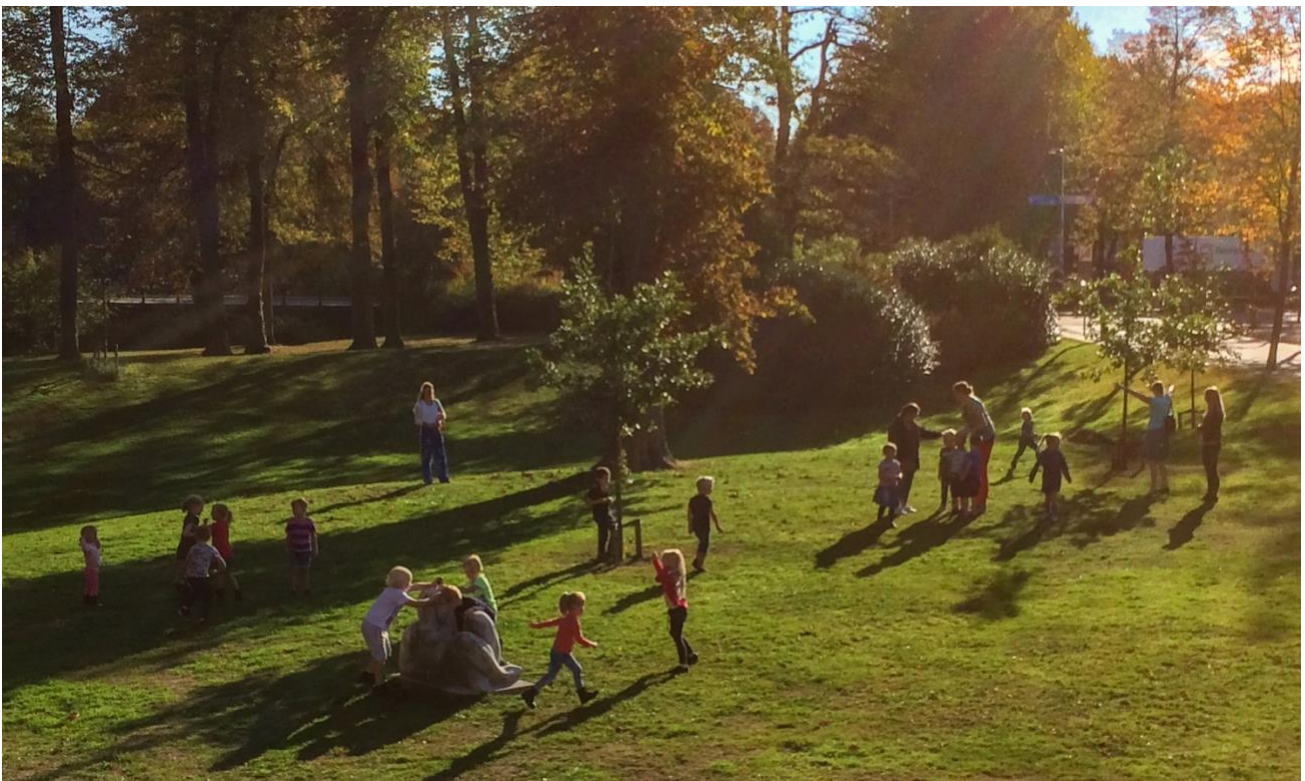
Activiteiten in park

Het bestuur vergaderde in 2019 vijfmaal. Onderwerpen waren onder andere huisvesting Zutphen, financiën, projecten en innovatie.