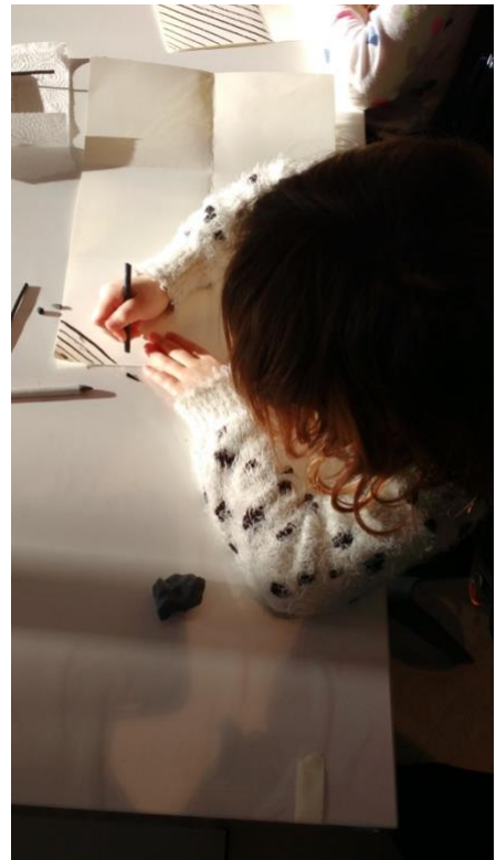
Kunstles op basisschool uit Cultuurmenu

Het cultuurbonusprogramma (buurtsportcoachregeling) droeg bij aan meer bewegen voor kinderen door dans- en circusworkshops, zowel onder als na schooltijd. 90 procent van alle basisscholen (waaronder twee speciaal-onderwijscholen) en twee buitenschoolse opvangen (BSO's) deden mee. Het