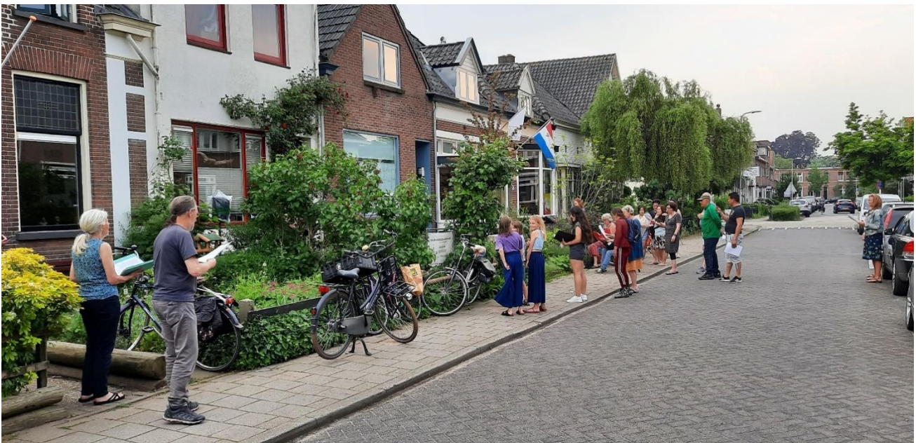
7 Straatzingen met Zutphen Zingt Werelds Koor

Het koor Zutphen Zingt Werelds, de 40 leden bestaan voor 50 procent uit nieuwkomers, heeft weinig gerepeteerd op de locatie Zutphen bij Muzehof vanwege de restricties voor koren die langer duurden dan die voor andere groepen. Wel is een deel van het koor doorggegaan met zingen op straat voor het huis van de dirigente, met daarbij ook mensen uit de straat. Vanaf maart tot en met juni 2020 hebben we hier, eerst in de kou en in het donker, later lekker warm en licht, elke donderdagavond een uurtje samen gezongen, met pianobegeleiding. Bij de livestream van de Hanzehof (Samen voor Zutphen) mochten we hier vlak voor Pasen over vertellen en werd er een filmpje getoond van het zingen.