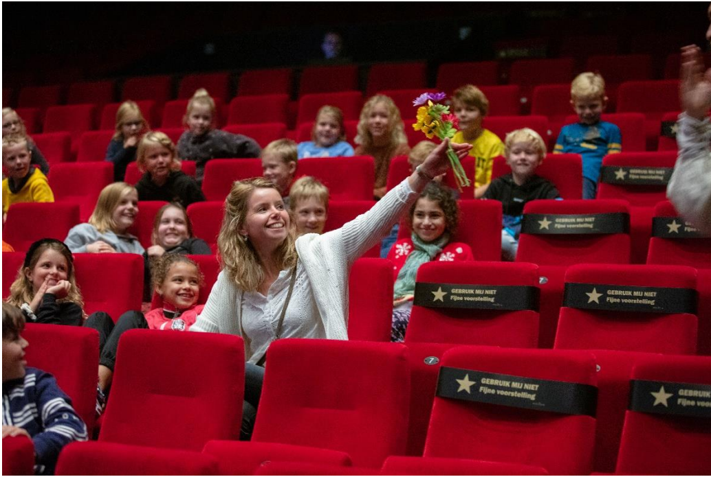
2 Leerkrachten voeren het cultuuronderwijs uit.