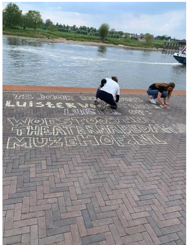
8 Theater Na de Dam: Jongeren aan de IJsselkade

"4 mei 2020 een uur of 19.45 De jongeren die deelnamen aan dit project zitten in duo's verdeeld aan de kant van de Hoven aan de rand van de IJssel. Dezelfde rivier die er toen, 75 jaar geleden, ook stroomde. Bij zich een mobieltje of radio om daarop de luistervoorstelling Het kwam via de achtertuin te luisteren. Aan de overkant, de stad Zutphen, waar de verhalen uit de luistervoorstelling zich afspeelden, aan de toren wappert de Nederlandse vlag en langzaam wordt het stil."