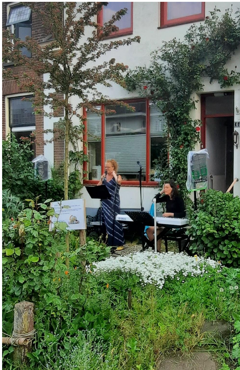
1 Dirigenten van Zutphen Zingt Werelds Koor orkestreren Straatzingen in coronatijd