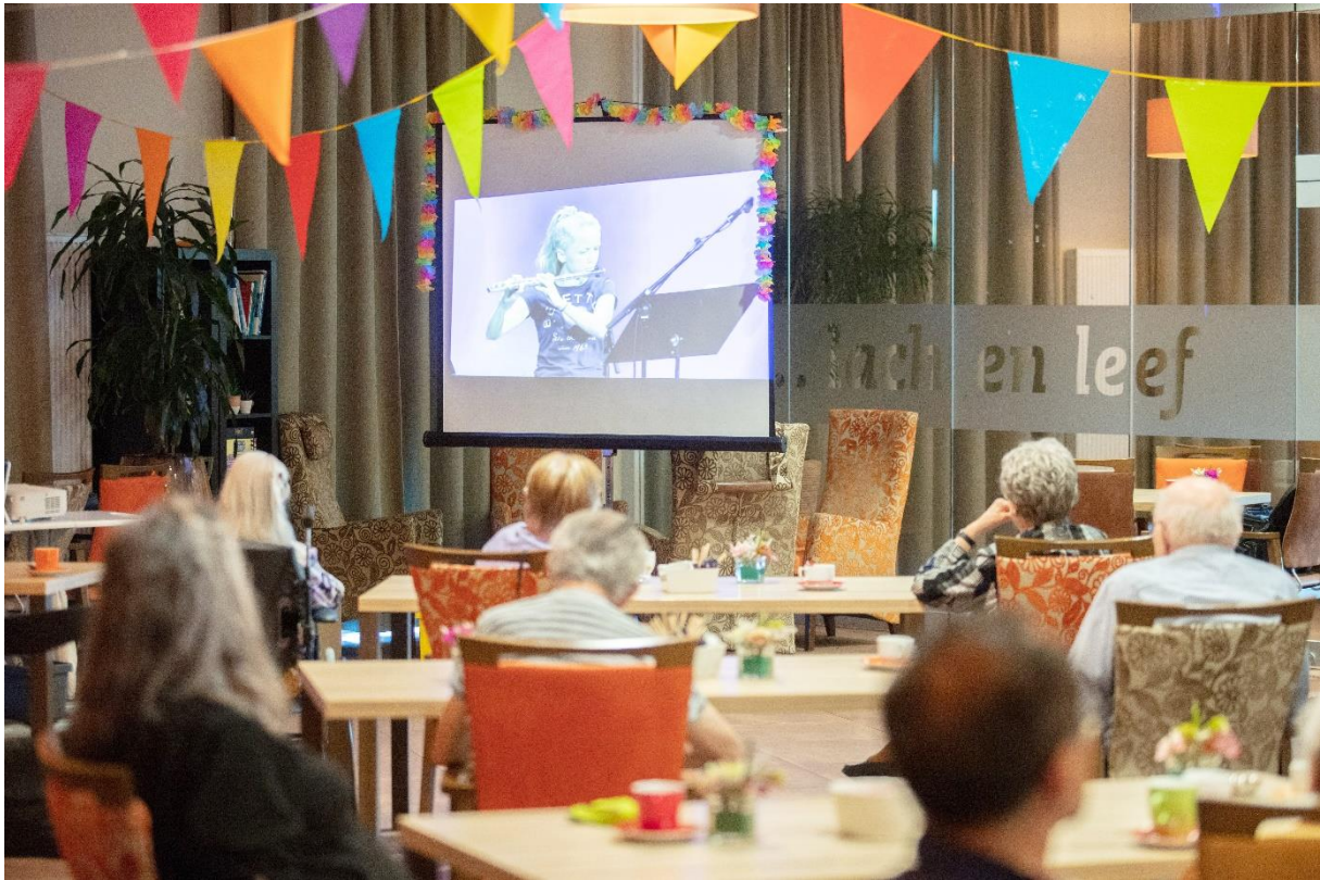
9 Livestream van optreden muzikleerlingen zorgde voor de eerste samenkomst van bewoners De Polbeek sinds maanden lockdown.