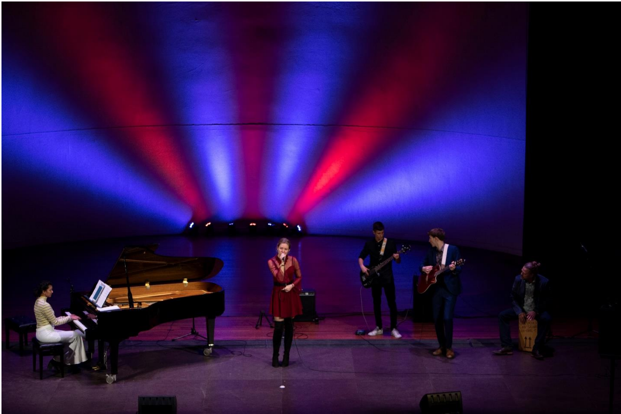
6 Talentenklas pop/jazz Sponsorconcert Hanzehof